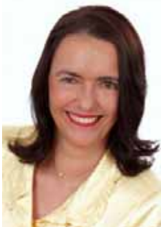
Nicole Bracht-Bendt, MdB

der Kinderkommission des Deutschen Bundestags gewählt.