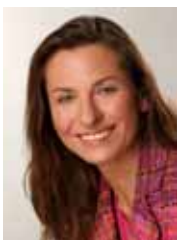
A. Thein, MdEP

Mit einer Liste, die von einer Frau angeführt wurde, hat die FDP bei den Europawahlen im Juni 2009 erreicht, wovon andere Parteien nur träumen können, und das ganz ohne Quoten und Reißverschlussprinzip: die FDP ist mit einer zu 41,67 Prozent weiblichen Gruppe im Europäischen Parlament, und der bei Weitem höchsten Steigerung des Frauenanteils unter allen deutschen Parteien, dem Allgemeintrend weit voraus. Betrug der Frauenanteil im Europäischen Parlament im Jahr 1979 noch lediglich rund 16 Prozent, so hat