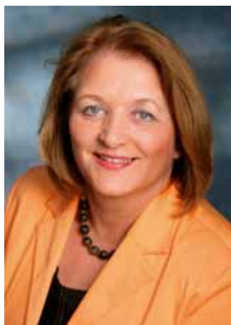
Sabine Leutheusser-Schnarrenberger Bundesministerin für Justiz

Sabine Leutheusser-Schnarrenberger ist eine Frau, die zu ihrer Meinung steht. Sie hat dies immer wieder bewiesen. Aus politischer Überzeugung hat sie den sogenannten „großen Lauschangriff“ abgelehnt. Nach einem entgegenstehenden knappen Mitgliederentscheid der FDP wollte sie diesen Entscheid als Ministerin nicht ausführen. Sie trat deshalb im Januar 1996 als Ministerin der Justiz zurück.