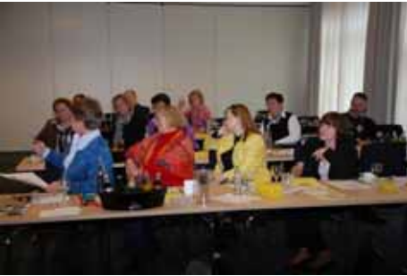
Die Veranstaltung in Paderborn war gut besucht

(db) Der Förderverein LIBERALE FRAUEN hatte am 17.10.2009 zur Jahrestagung nach Paderborn eingeladen. Die Tagung stand unter dem Motto: Machen Frauen anders Politik?